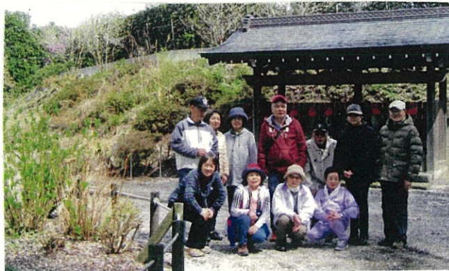
常楽院の枝垂れ桜の下で記念撮影

そして最後に雉の雄が姿を見せてくれて、しばらく立ち止まり、お互いに見つめあったりして、三ヶ島の春を満喫した1日でした。（吉田みよ記）