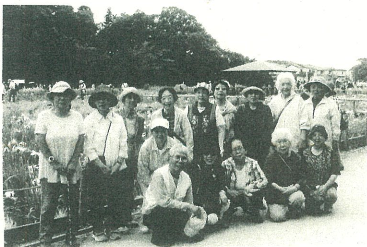
交流！楽しいひととき 北山首草蒲園での