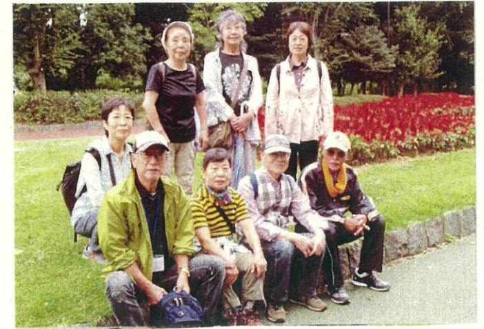
航空公園のサルビアの花壇の前で