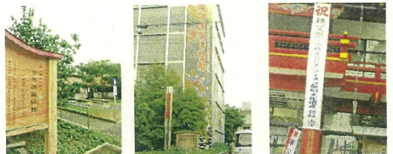
秩父夜祭りがユネスコ無形文化遺産に登録