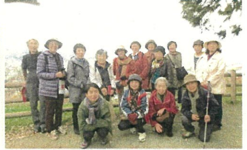
紅葉の見事なのはドウダンツツジとイチョウ 丘からは秩父市内が見渡せます

昼食は地元医療生協さん推薦のお蕎麦屋さん「立花」で。料金の割には品数も多く、皆さん満足されたのでは・・・