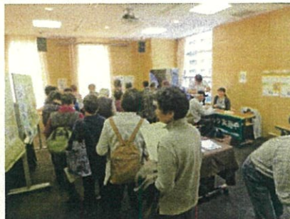
骨密度・血管年齢測定は人気があり、並びます