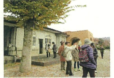
この他にオハギがつきました ちちぶ銘仙館の前 昭和5年の建物です 大谷石積みの外装

『ちちぶ銘仙館』でビデオを見ながら銘仙の行程を知り、たっぷり時間を掛けて回りました。初めての方も多くいました。ゆっくり歩いて30分程で『秩父神社』と『まつり会館』へ、ここも入館が無料でした。