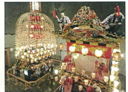
まつり会館ではユネスコ無形文化遺産に登録された秩父夜祭の山車が展示されています