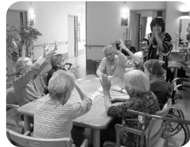
★洗濯ばさみゲーム★