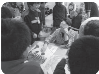
..... 明峰小学校児童交流会 .....