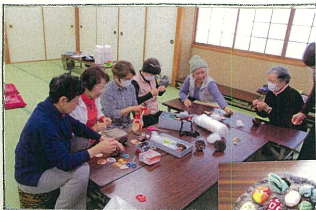
(お正月らしく華やかに)...