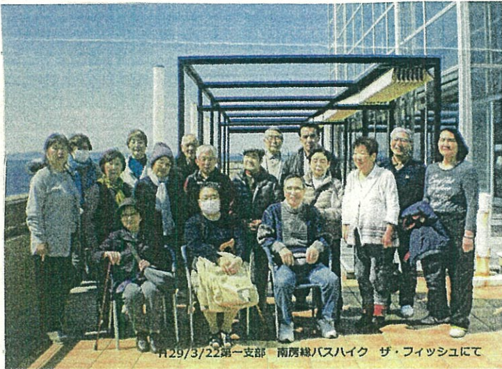
H29/3/22第一支部 南房総バスハイク サ・フィッシュにて

春の房総を目差し出発。行ききの車中で総会を開催しました。海ほたるで休憩。千葉県に入り富津影丸海苔工場を見学。試食した生海苔の味噌汁は絶品でした。浜金谷ザラツシで昼食。ショッピングを。君津濃漬の庵を見学散策後帰路へ。その車中は楽しいカラオケ大会となり、多量の涙もありました。無事、所沢に帰ってきました。