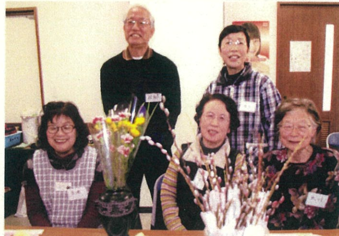
1月度の誕生日の方は5人もいました