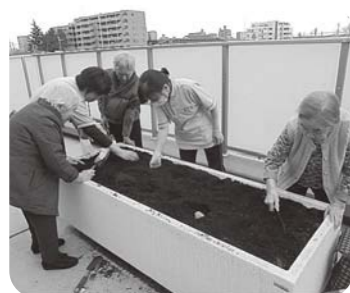
3月じゃがいも植え

ます。おやつレクの、みんなの楽しみがまた出来ました。4階菜園は、きゅうりやトマトも育てていて、みんな成長を楽しみにしています。