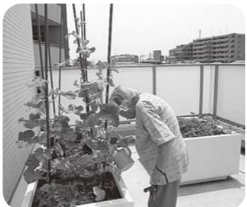
これからのおたのしみ