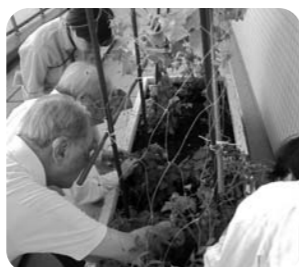
ミニトマトの収穫