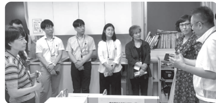
韓国医療福祉生協のみなさんの訪問時の様子