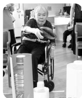
景品当てよう! 輪投げ・射的ゲーム