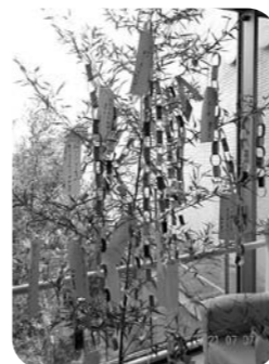
願いを込めて短冊飾り

新型コロナウイルス感染症の感染拡大により、引き続き入居者の活動の制限が続いていますが、職員・入居者みんなで久しぶりに“非日常”を感じながら、楽しい時間を過ごすことができました。