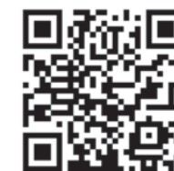
桂の樹 ホームページ