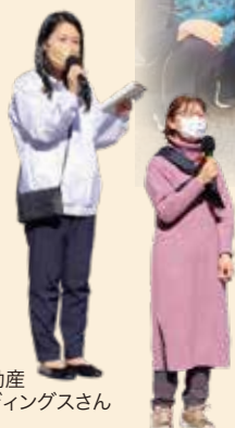
北斗不動産 ホールディングスさん