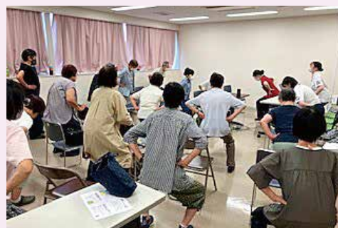
先日所沢第1支部の学習会の様子。皆さん強い関心を示されていました。